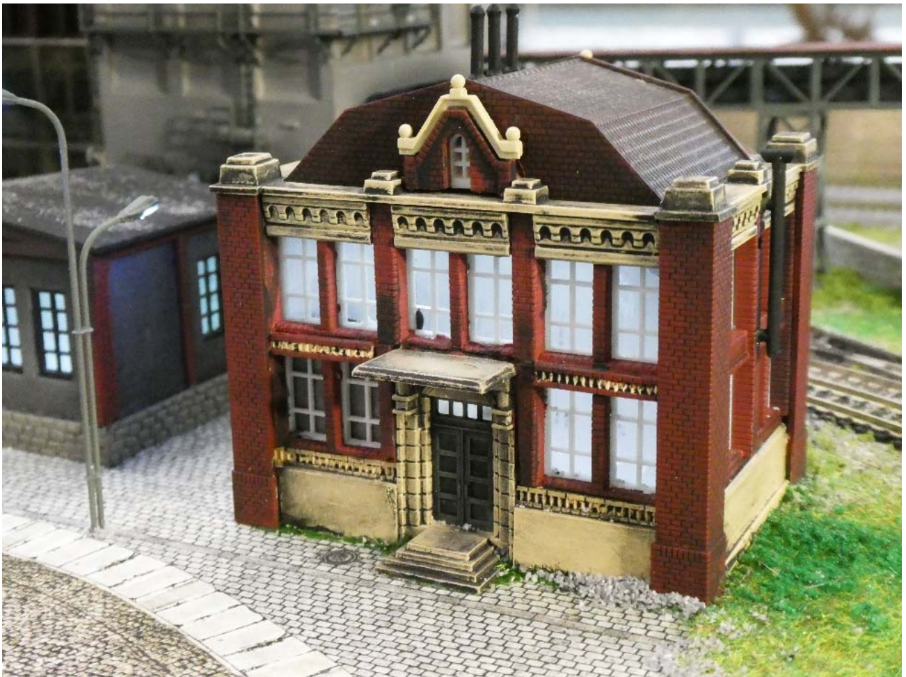
Verwaltungsgebäude der Zeche