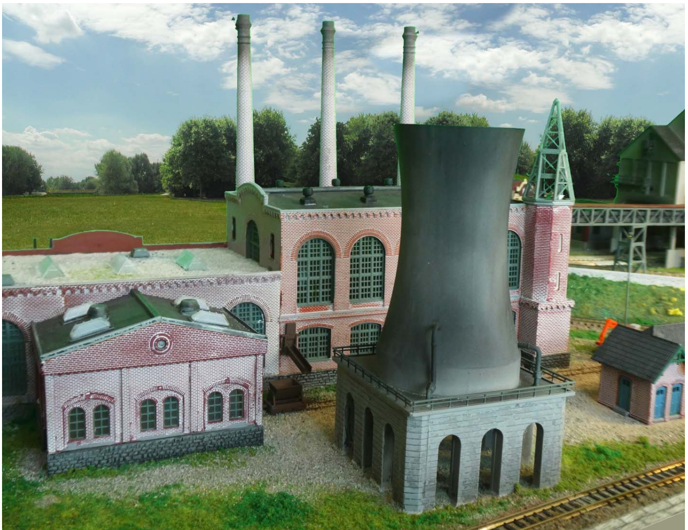
Kühlturm am Kraftwerk