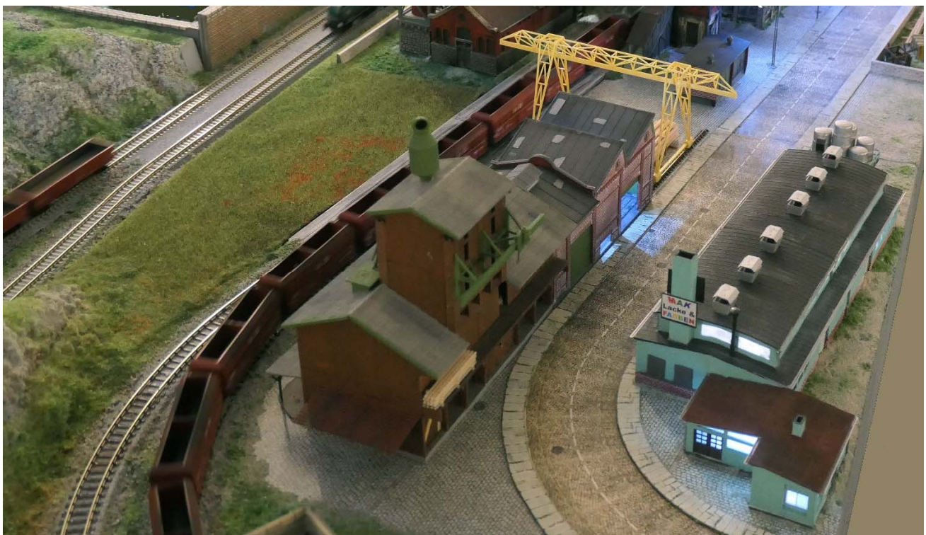
Sägewerk und Farbenfabrik