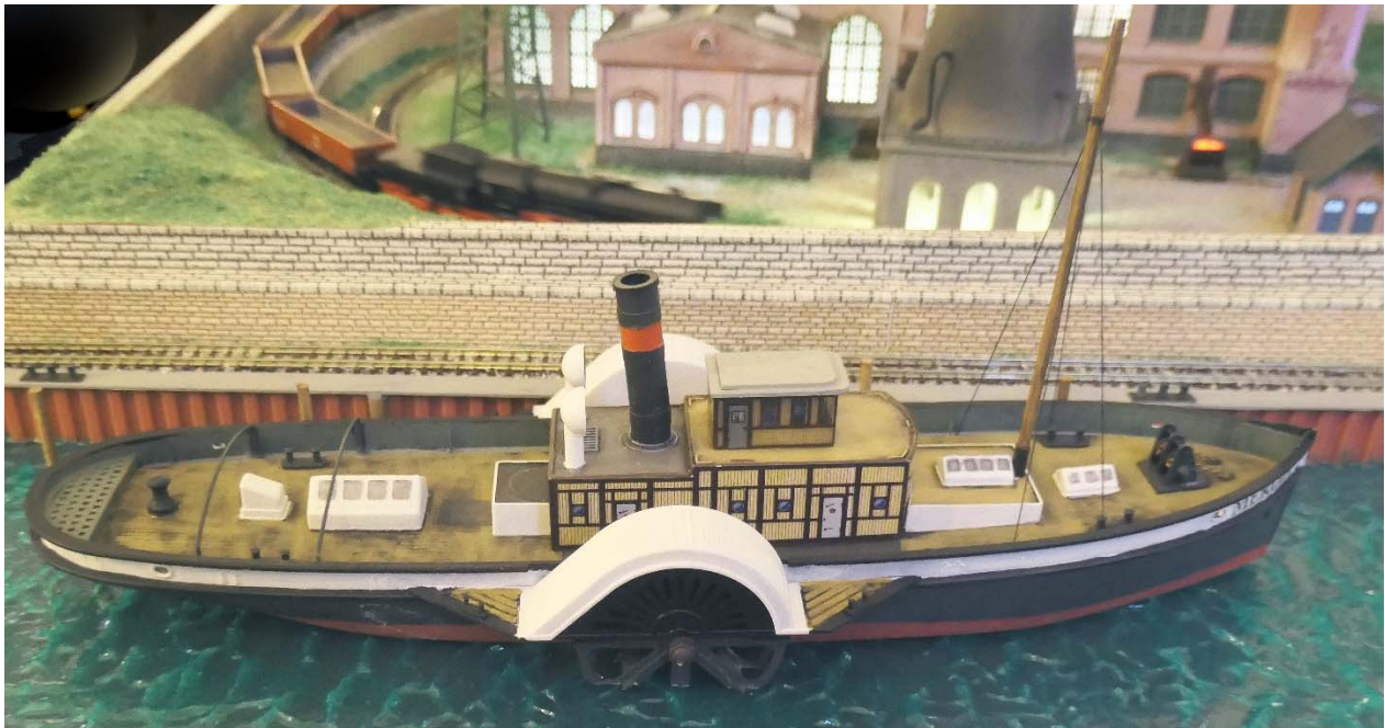
Radschlepper im Hafen