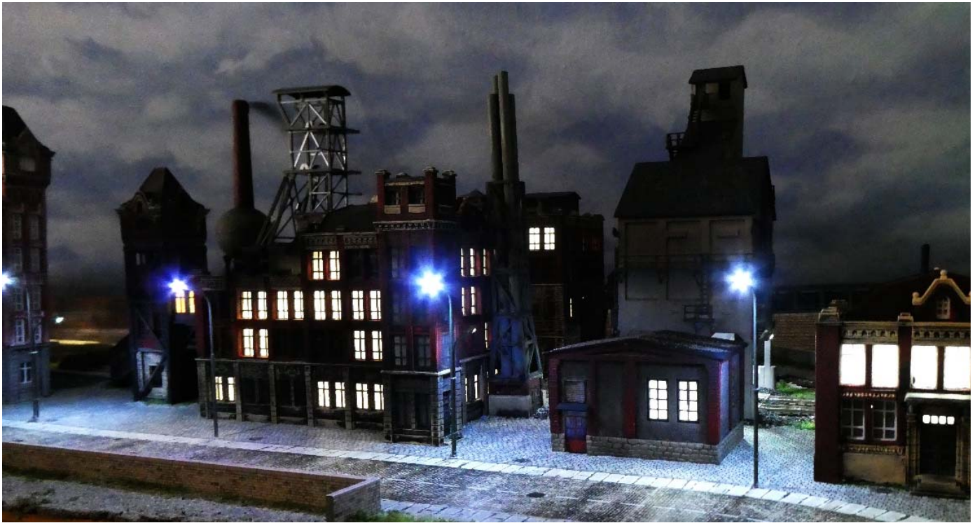
Zeche bei Nacht