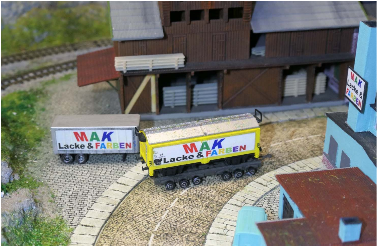
Verladung an der Farbenfabrik