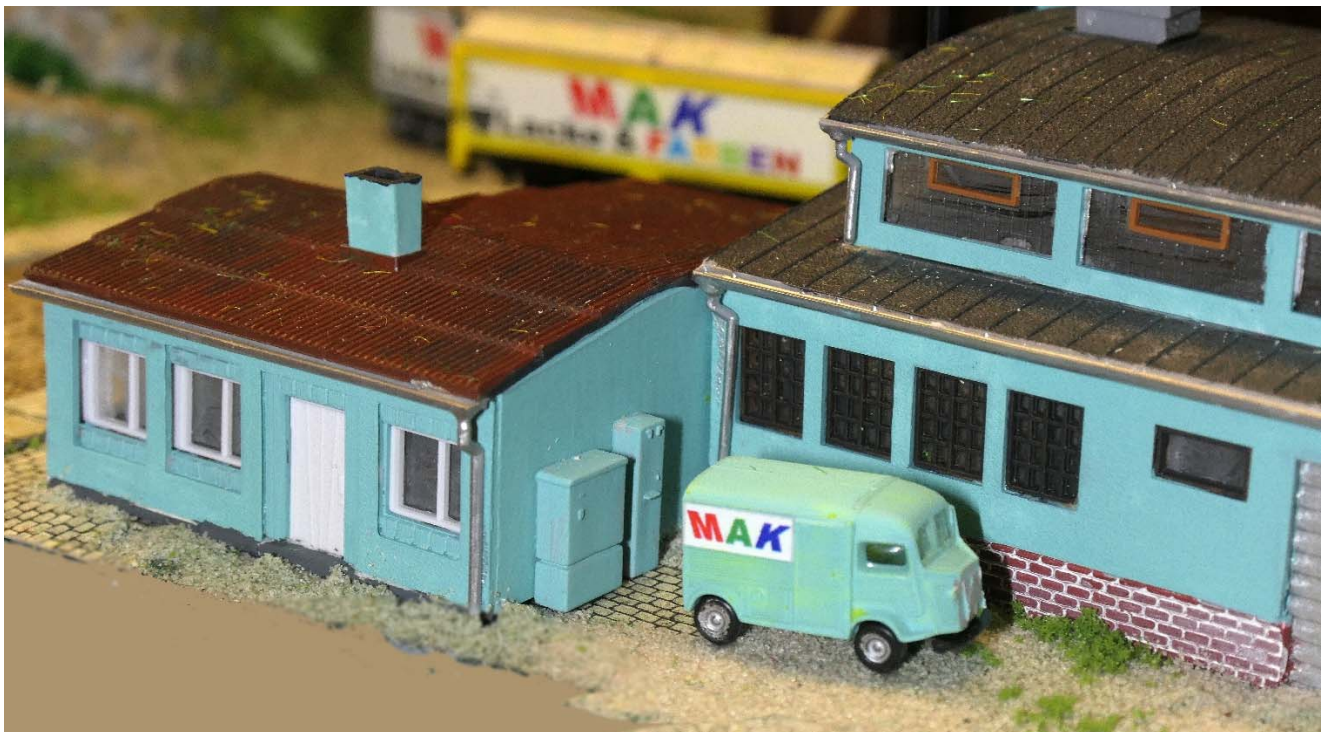
Verwaltung der Farbenfabrik