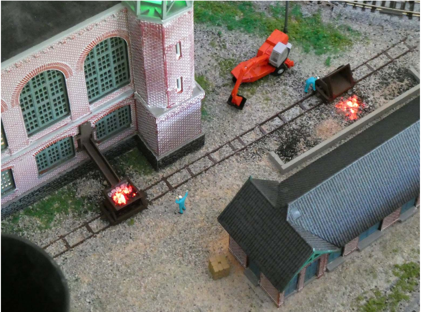
Ausschlacken am Kohlekraftwerk