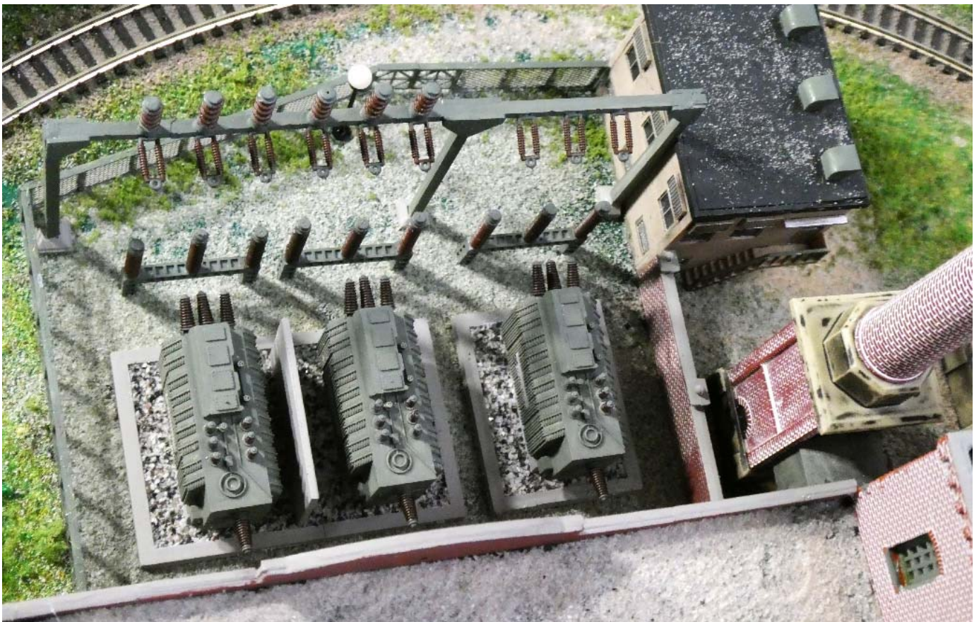
Blick von der Turbinenhalle